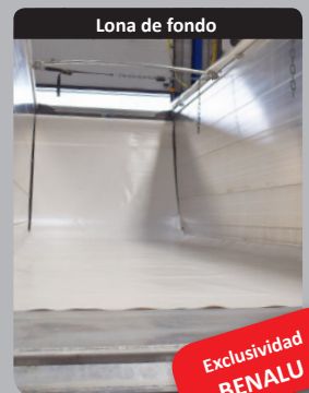
Lona de fondo

Puerta innovadora, diseñada específicamente para el transporte de remolacha!