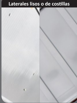
Laterales lisos o de costillas

¡Laterales lisos o de costillas lo que favorece el peso o la estética!