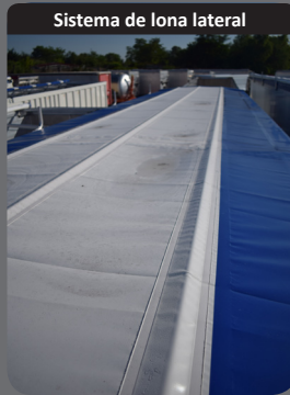
Sistema de lona lateral

Puerta universal de doble cierre, doble articulación y trampillas cerealistas