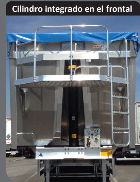
Cilindro integrado en el frontal

Limita la retención del producto al vuelco y promueve el flujo.