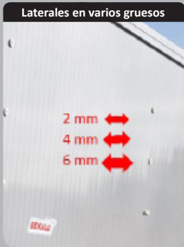
Laterales en varios groesos

Posibilidad de mezclar diferentes groesos interiores de laterales que responde a las solicitudes de descarga.