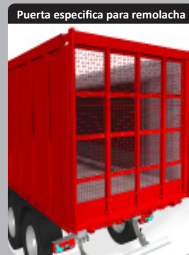
Puerta específica para remolacha

Puerta innovadora, diseñada específicamente para el transporte de remolacha!