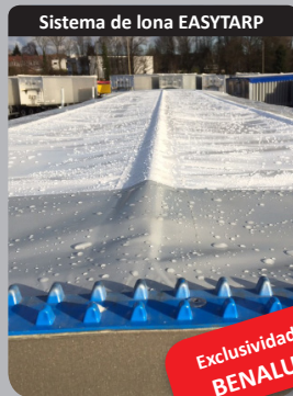
Sistema de lona EASYTARP

Posibilidad de mezclar diferentes groesos interiores de laterales que responde a las solicitudes de descarga.