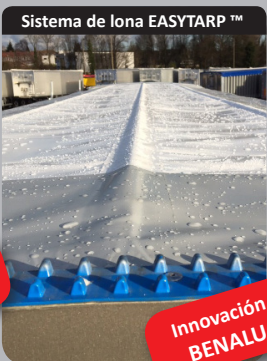
Sistema de lona EASYTARP™

Sistema de lona EASYTARP™ eléctrico Totalmente automatizado por control de radio.