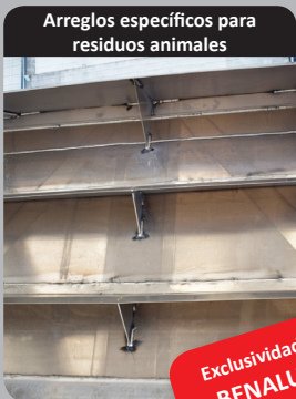
Arreglos específicos para residuos animales

Más de 15 dispositivos específicamente adaptados al transporte de residuos animales