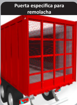
Puerta específica para remolacha

Puerta innovadora, diseñada específicamente para el transporte de remolacha!