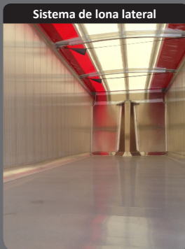
Sistema de lona lateral

Puerta universal de doble cierre, doble articulación y trampillas cerealistas