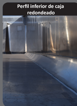
Perfil inferior de caja redondeado

Sistema de lona lateral, fijación por cintas en todo tipo de puertas