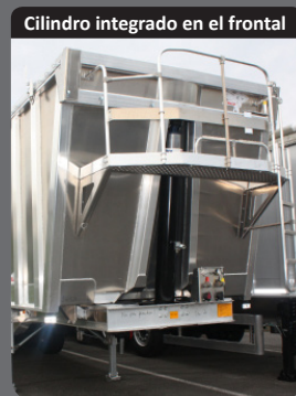
Cilindro integrado en el frontal

Limita la retención del producto al vuelco y promueve el flujo.