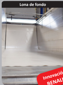
Lona de fondo

Puerta innovadora, diseñada específicamente para el transporte de remolacha!