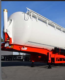
Citerne 100% aluminium

Bidon aluminium aux bases renforcées de 2550mm de diamètre.