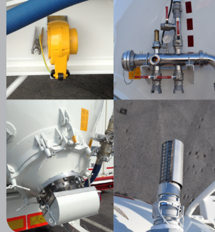
Dispositifs spécifiques : alimentaire, chimique et minéral

Nombreux dispositifs spécifiques à chaque type de transport (vannes, filtres...)