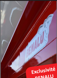
Chassis en «J»