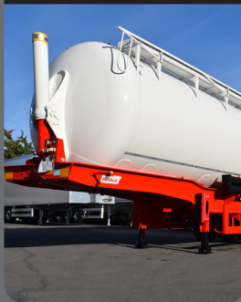
Cisterna 100% de aluminio

Cisterna de aluminio con bases reforzadas de 2550mm de diámetro.