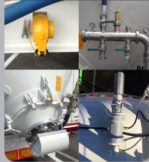
Dispositivos específicos: alimentos, productos químicos y minerales

Varios dispositivos específicos para cada tipo de transporte (válvulas, filtros, ...)