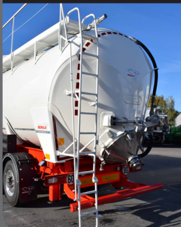
Parte trasera recta

Parte trasera recta que ofrece una ganancia de volumen, distancia al suelo y una mejora del voladizo.