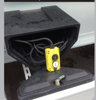
Grupo de vuelco

Grupo de vuelco, mando remoto con cable de 20 metros.