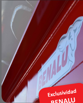
Chasis en forma de «J»