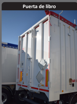
Puerta de libro

Costillas laterales dobladas en la parte trasera, aumento en la rigidez de las paredes