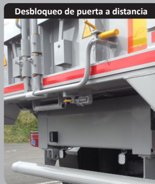
Desbloqueo de puerta a distancia

«Parte superior reforzada por un borde de 260mm de altura sobre más de 65mm de ancho.