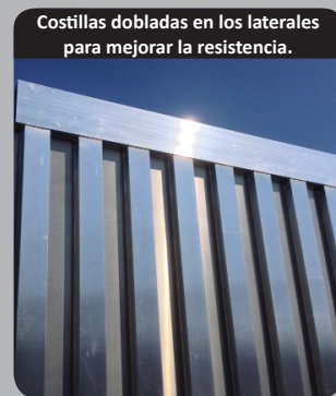
Costillas dobladas en los laterales para mejorar la resistencia.

Aumento de la seguridad debido al desbloqueo a distancia de la puerta.