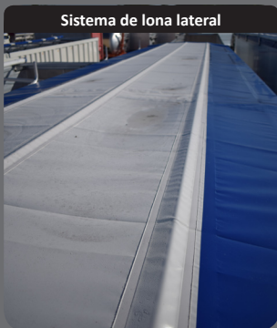
Sistema de lona lateral

«Caja trapezoidal que optimiza el volumen y facilita el flujo del producto.»