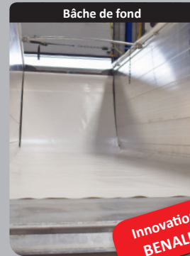
Bâche de fond

Dispositif de bâche de fond étudié pour faciliter l'écoulement des produits collants et assurer une totale sécurité (Brevet n°FR2976532)