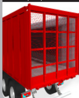
Porte spécifique betterave

Porte innovante, spécifiquement conçue pour le transport de betteraves !