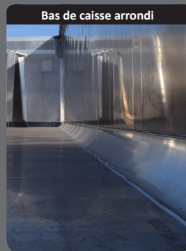
Bas de caisse arrondi

Limite la rétention de produit au bannage et favorise l'écoulement.