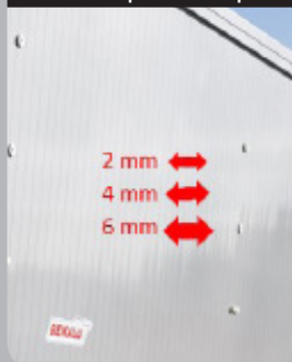
Différentes épaisseurs de paroi

Partie intérieure de la paroi de différentes épaisseurs afin de répondre idéalement à chaque type de chargement !