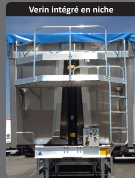
Verin intégré en niche

Verin à oeil intégré en niche qui optimise le volume total