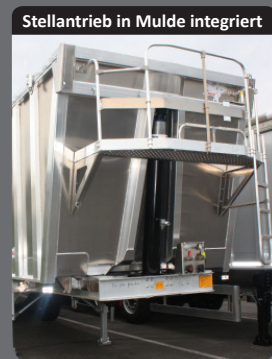
Stellantrieb in Mulde integriert

Sorgt dafür, dass kaum Produkte beim Kippen zurückbleiben und unterstützt die Entladung.