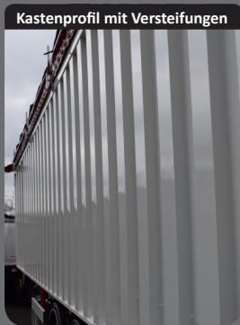
Kastenprofil mit Versteifungen

Kastenprofil mit Versteifungen, das für eine geringe Verformung sorgt und dabei das Gesamtgewicht des Fahrzeugs optimiert.