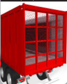
Porte spécifique Betterrave

Porte innovante, spécifiquement conçue pour le transport de betteraves !