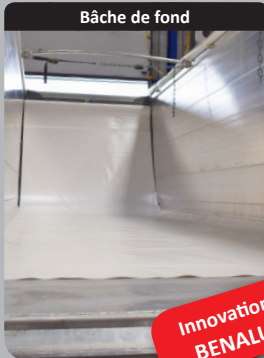
Bâche de fond

Dispositif de bâche de fond étudié pour faciliter l'écoulement des produits collants et assurer une totale sécurité (Brevet n°FR2976532)