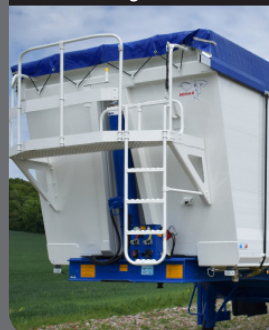
Vérin intégré en niche

Vérin à oeil intégré en niche qui optimise le volume total !