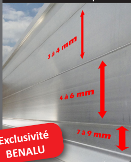
Faces latérales uniques !