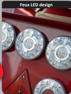
Feux LED design

Feux full LED qui offrent une consommation d'énergie et un design particulièrement réussi !